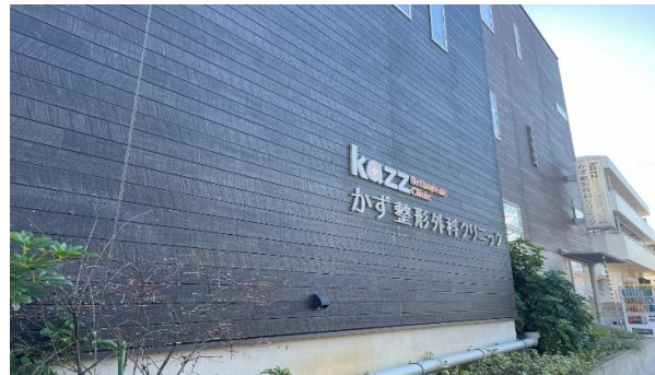
丸山台のバス停を過ぎると左手に当院があります