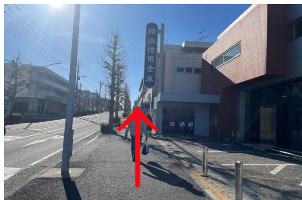
横浜信用金庫を右手にまっすぐ進みます