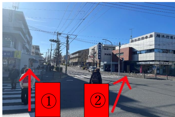
イトーヨーカドーを過ぎた先の信号を②の方向に進みます